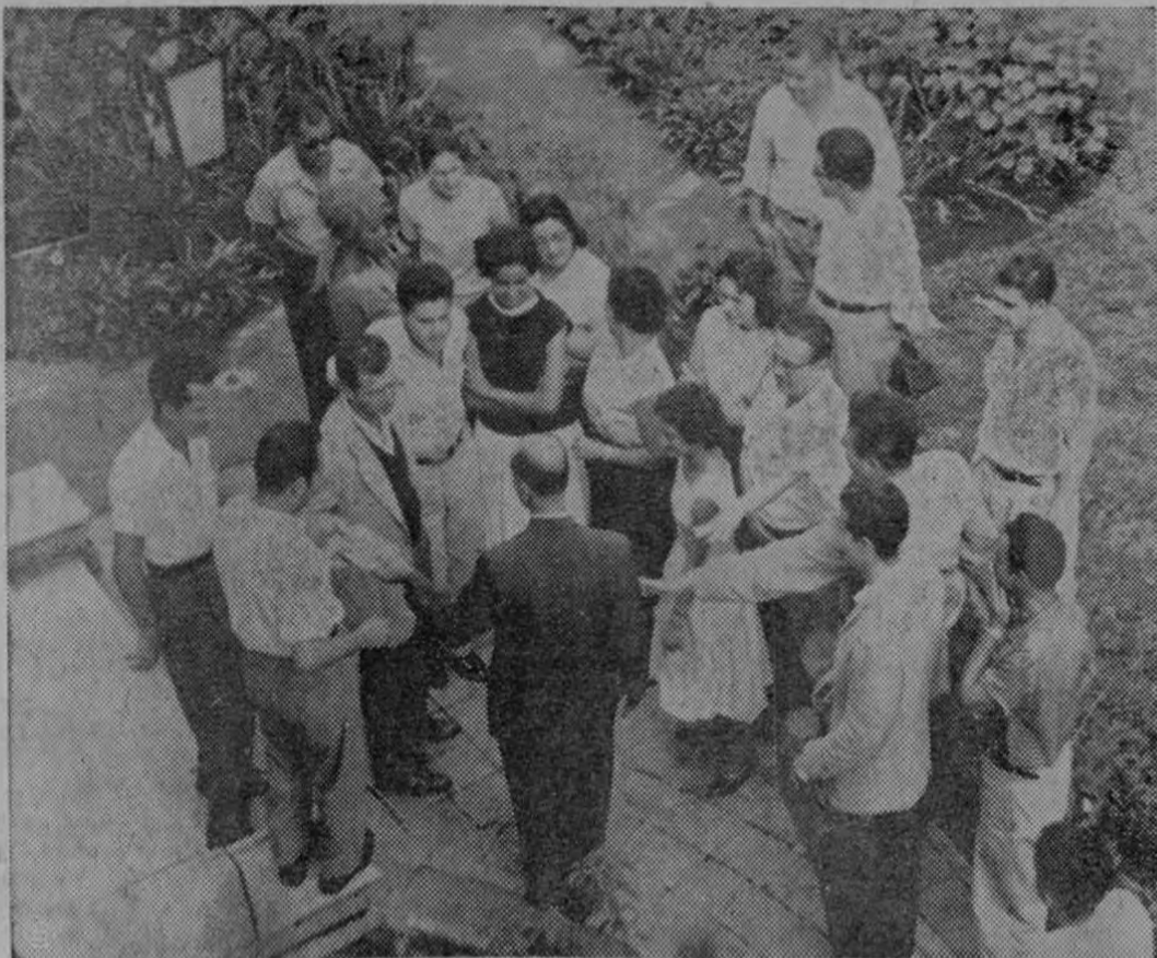
TRABAJADORES DEL CONSEJO de Defensa Social en su movimiento de paro esta mañana a las 9 horas cuando aún no había decidido el Gobierno de la República cancelar ape-

nas una de las cuotas de ¢ 316.000 que le adeuda al sistema penitenciario. Los trabajadores comenzaron a trabajar de nuevo a las 10 y media de la mañana.